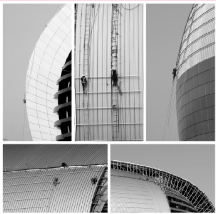
奥体中心建设者

46、人生就是一场修行, 路很长很陡, 也许你走得很累, 想要放弃是理所当然。然而, 你若是停住了前进的脚步, 路永远在前方, 那里永远有一个你到不了的远方。