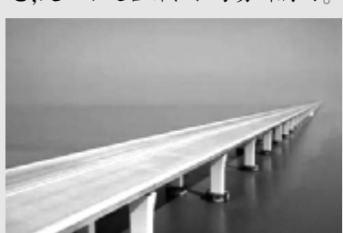
人生如混凝土,在七八十年寿命中,要能抗压力,抗打击,耐腐蚀,抗疲劳.....千万别中途就被拆了。