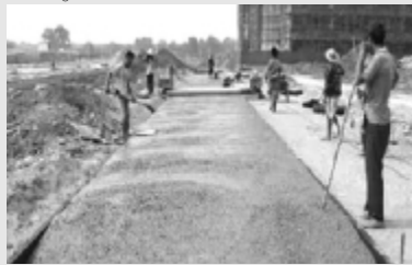
人生如混凝土,在起初凝结成型的时候,成了就成了,没成就废了。