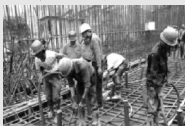
人生如混凝土,在成型的过程中不多振捣振捣,就会松松垮垮的,无法密实坚强。