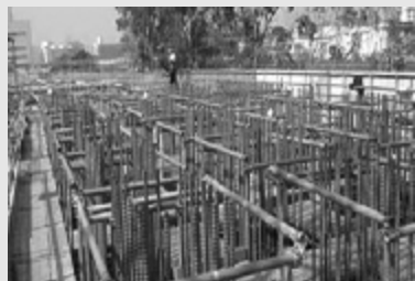
人生如混凝土,内心没有钢筋意志,是经不起各种扭扭弯弯折腾的。