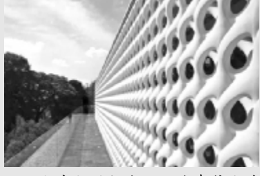
人生如混凝土,不论在什么地方,要有刚度,也要有一定的弹性,越超静定才越安全。