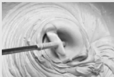
人生如混凝土,生出来的时候就那么一滩,谁知道将来会成什么模样。