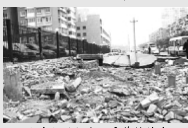
人生如混凝土,看着很结实,一旦承受不了压力就酥了,成了建筑垃圾,也再没机会成型了。