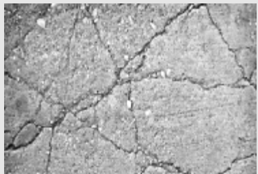
人生如混凝土,是要带裂缝工作的。