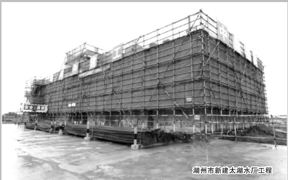
湖州市新建太湖水厂工程

这些获奖工地,努力实现节能、节地、节水、节材和环境保护,最大限度减少对环境产生负面影响,着力提升绿色施工的规范化、标准化、效益化,为全市“治水、治气”工作推进贡献力量。