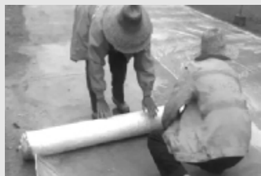
人生如混凝土,是需要养护的。